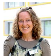
Verfasserin: F. Haupt Krankenseelsorgerin im Klinikum

Ich denke über mein Leben nach. Ich habe hier Zeit dazu. Viele sorgen sich um mich. Das tut mir gut. Es wird mir helfen.